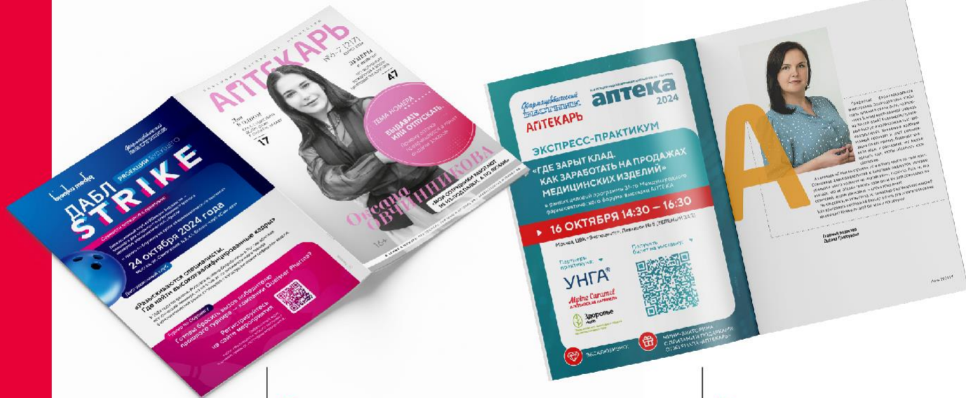
↓ 4-я обложка журнала

Премиальное позиционирование. Максимальный охват контактов с фармацевтами.